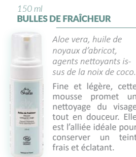
150 ml BULLES DE FRAÎCHEUR

Aloé vera, huile de noyaux d'abricot, agents nettoyants issus de la noix de coco.