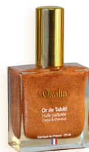
50 ml OR DE TAHITI

Gourmandes, exotiques et délicieusement sucrées, ses effluves de monoï transportent vers des îles paradisiaques et font planer une douce sensation de soleil, de sable chaud et de vacances.