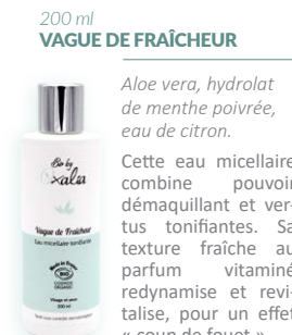
200 ml VAGUE DE FRAÎCHEUR

Aloé vera, hydrolat de menthe poivrée, eau de citron.