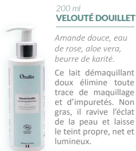
200 ml VELOURÉ DOUILLET

« Retrouvez une peau nette, lumineuse et éclatante ! »