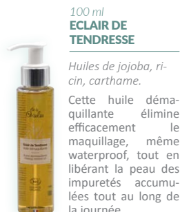
100 ml ECLAIR DE TENDRESSE