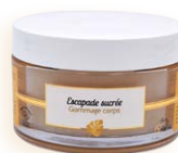
200 ml ESCAPADE SUCRÉE