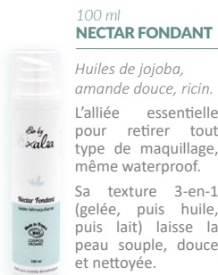
100 ml NECTAR FONDANT

Huiles de jojoba, amande douce, ricin. L'alliée essentielle pour retirer tout type de maquillage, même waterproof.