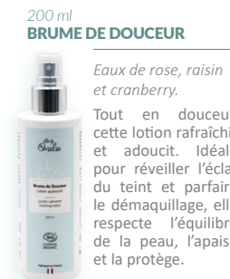
200 ml BRUME DE DOUCEUR